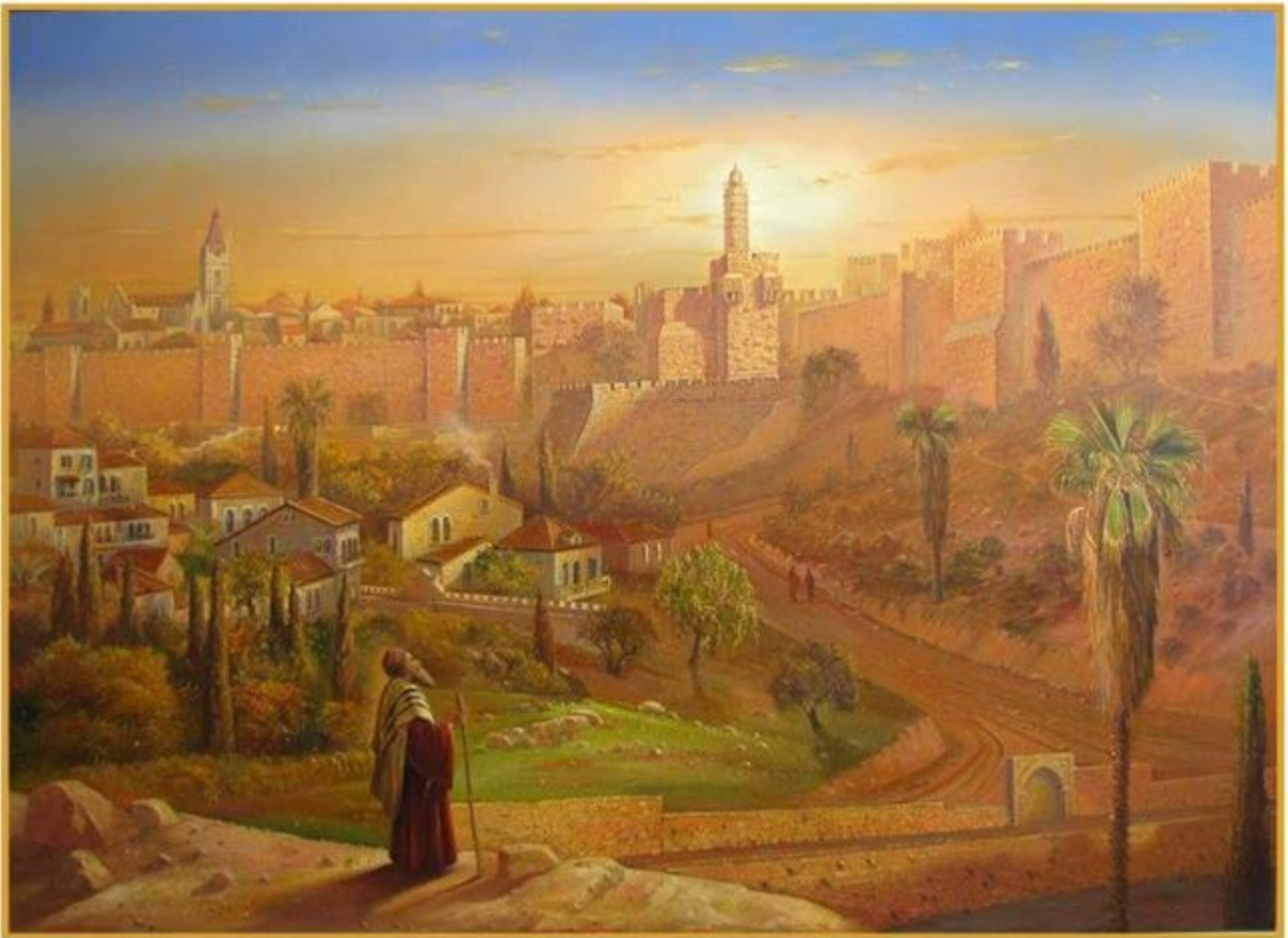
Jerusalem at first Sight 130-180