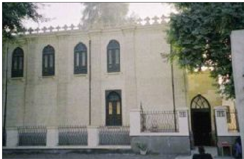
La Sinagoga Ben Ezra, El Cairo Viejo.