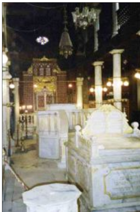
Interior de la Sinagoga Ben Ezra, con el genizah visible en el fondo.

Los Musulmanes primitivos conocieron a los Judíos como “el Pueblo del Libro.” Los Musulmanes encontraron notable la afinidad que los Judíos tenían para sus textos, y el respeto que tenían por material escrito – las costumbres como no doblar la esquina de una página para actuar como un marcador de libros; y todavía la aceptabilidad de poner notas en los márgenes. Durante las persecuciones Medievales, los Judíos a menudo rescataban libros después de la confiscación por las autoridades Cristianas. 14