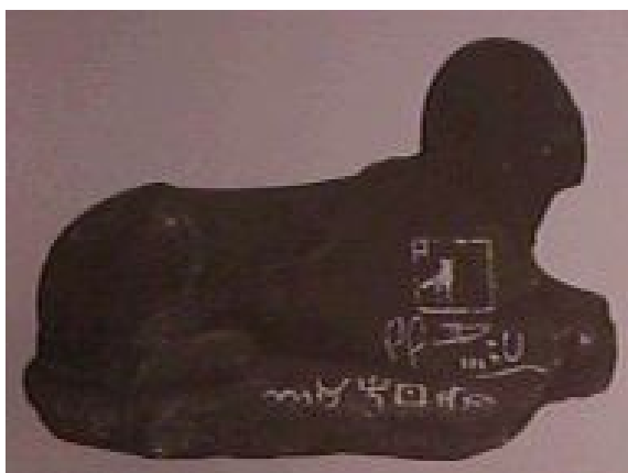
Esfinge descubierta por Petrie a Serabit El Khadim.

En la costa oriental de la Península de Sinai - el gran y terrible desierto del Éxodo - existe un lugar llamado Serabit El Khadim, en el que los egipcios desarrollaron minas de turquesa. La turquesa es una piedra semipreciosa encontrada junto a mena cobriza. Los obreros de las minas eran personas Semíticas, quizás contemporáneos a la estancia Israelita en Egipto, aunque probablemente no incluyéndolos dada la naturaleza de sus prácticas religiosas. Sin embargo, ellos hablaron un mismo idioma similar al Hebreo. En 1905, el señor Flinders Petrie descubrió varios artefactos entre ellos la esfinge. Ellos estaban grabados con escritura alfabética y jeroglíficos clásicos, ambos con el mismo mensaje. Una coincidencia feliz similar ocurrió con la piedra de Rosetta famosa (encuentrada en Egipto por los soldados de Napoléon) que permitió a los estudiosos trabajar del conocido griego a los entonces indescifrados Jeroglíficos. Se cree que el alfabeto que nosotros usamos hoy tuvo sus orígenes en esta escritura del proto-Sinai así nombrada. Los estudiosos pueden rastrear su desarrollo a través de griego, a los alfabetos europeos en uso hoy. Ello es la base de alfabetos tan diferentes como Sánscrito, Árabe, Cirílico y Tailandés.